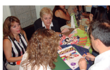
Taller Protegido Crecer Juntos.