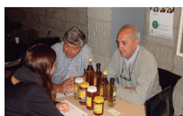
Cooperativa Agropecuaria La Regional LTDA.