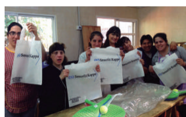
Asociación de Padres de Hijos Especiales (APHE).

El Programa Generar estaba apoyando hasta ahora seis emprendimientos productivos de organizaciones de base y, gracias a la incorporación de este nuevo socio, apoyará a partir de ahora un nuevo proyecto. Se trata del Taller Protegido APHE (Asociación de Padres de Hijos Especiales), ubicado en Bernal, Quilmes, provincia de Buenos Aires. El proyecto se propone construir una sala de revelado y un depósito, que permitirá incrementar la eficacia de las actividades que realizan algunas unidades de servicio y producción del taller: ensamblado de juguetes, serigrafía en distintas superficies y armado de eco-bolsas de friselina. El proyecto beneficiará directamente a 30 personas (operarios del taller protegido).