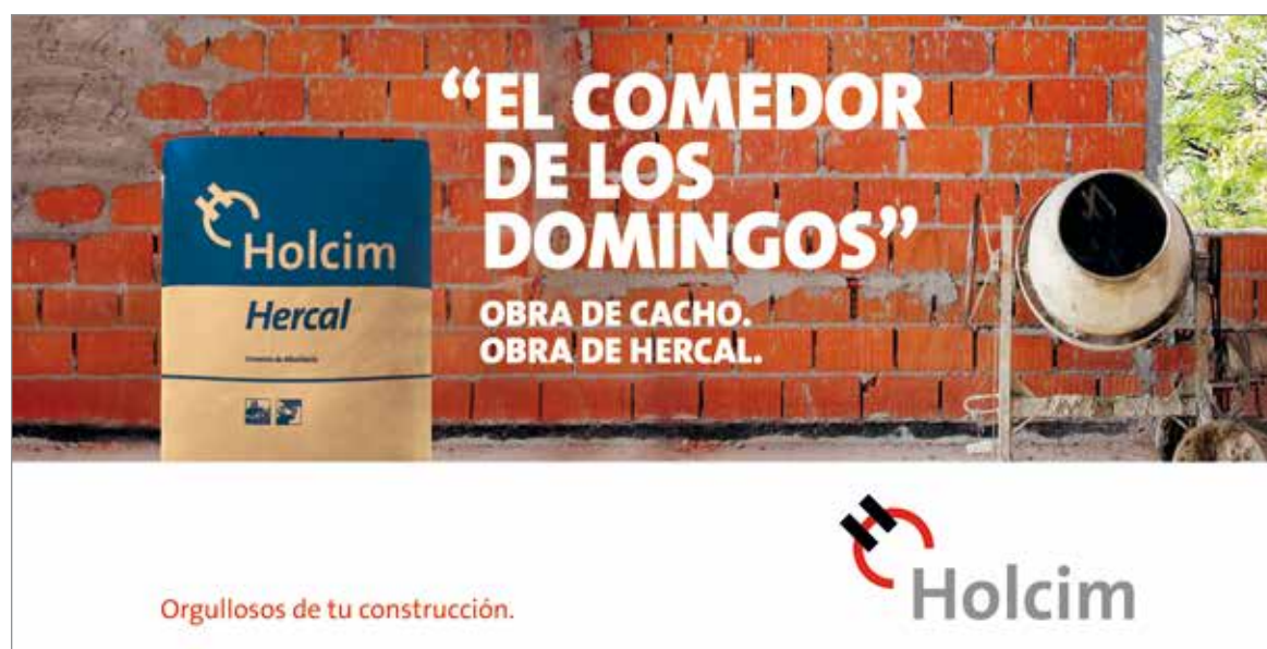
Gráfica utilizada en lunetas de colectivos en Córdoba.

Para Holcim, el proceso de distribución es fundamental, porque permite que Hercal llegue a las manos de quienes lo utilizarán para sus trabajos. Por este motivo, los transportistas y los distribuidores son una pieza clave que afianza el compromiso de la empresa con los usuarios. Así, el eslogan “Orgullosos de trabajar juntos” da cuenta de la importancia de quienes se encargan de acercar Hercal a su público.