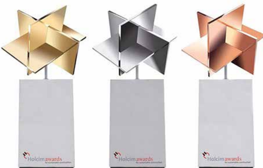
Holcim Awards Oro, Plata y Bronce para los proyectos más destacados.

La ceremonia de entrega de los premios y menciones para Latinoamérica se realizó en la ciudad de Medellín, Colombia. Este fue el tercero de una serie de cinco eventos que se realizaron a nivel regional en otras partes del mundo: el encuentro de competidores europeos tuvo lugar en Moscú y el de norteamericanos se celebró en Toronto, mientras que el certamen para la región África-Medio Oriente se llevó a cabo en Beirut, y para la zona Asia-Pacífico, en Yakarta. En todos los casos, los proyectos ganadores de los Holcim Awards Oro , Plata y Bronce en cada región quedaron calificados para competir por el máximo galardón Global Holcim Awards en 2015.