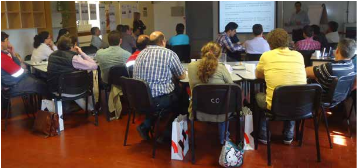
Durante el “1er Taller de Seguridad Vial”, referentes de las empresas transportistas toman nota de lo trabajado.

El taller fue un éxito, y contó con la presencia de alrededor de 30 empresas de transporte y representantes del departamento de Infraestructura y Logística de la Unión Industrial de Córdoba.