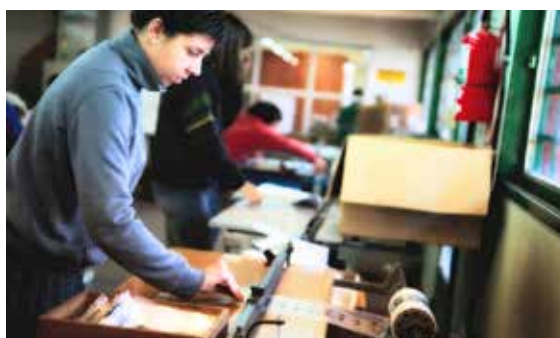
Los trabajadores de redACTIVOS, trabajando en el desarrollo de los productos que luego comercializarán.

La misión fundamental de redACTIVOS consiste en “fomentar la autonomía social y económica de los trabajadores con discapacidad, generando ingresos genuinos y sustentables”. Holcim Argentina, una vez más, acompaña esta iniciativa.