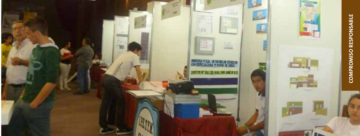
Jóvenes de escuelas técnicas participando del certamen.