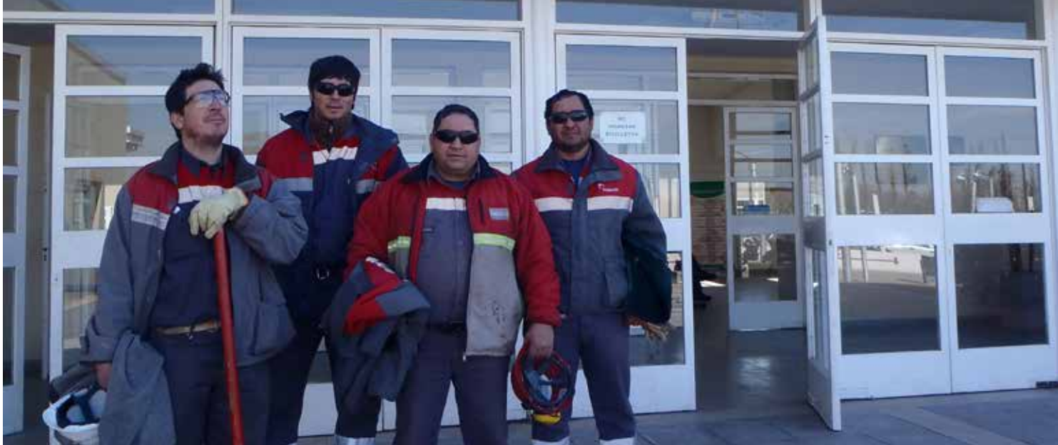
Voluntarios de Holcim que colaboraron en la construcción del patio de juegos del Hospital Ramón Carrillo, en Capdeville.