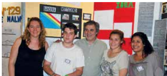
4° año - IPET 81 Dip. Duilio Jorge Georgetti (Ucacha).