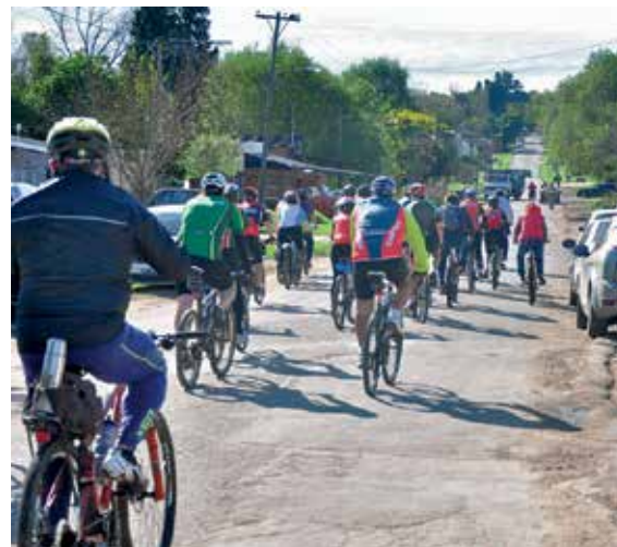
Bici Guías Ambientales en acción.