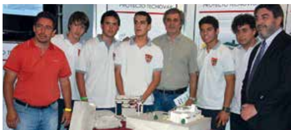
6° año - Instituto Privado El Obraje (Alta Gracia) + 1 Beca FIE.