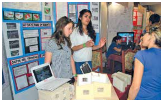
7° año IPETYM 61 General Savio (Córdoba).

“Sería muy positivo imponer la muestra como una actividad anual que fortalezca los lazos de cooperación y las comunicaciones entre las escuelas”.