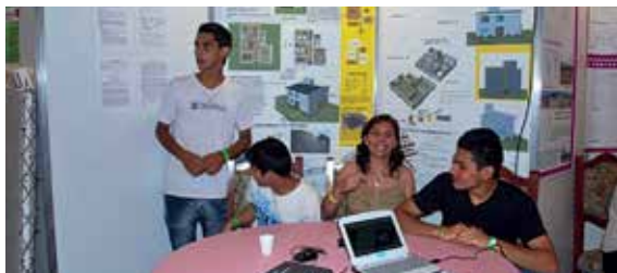
5° año - IPET 2 Rep. Oriental del Uruguay (Córdoba).