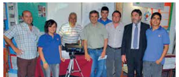
7° año - IPET 247 Ing. Carlos Cassaffouth (Córdoba).