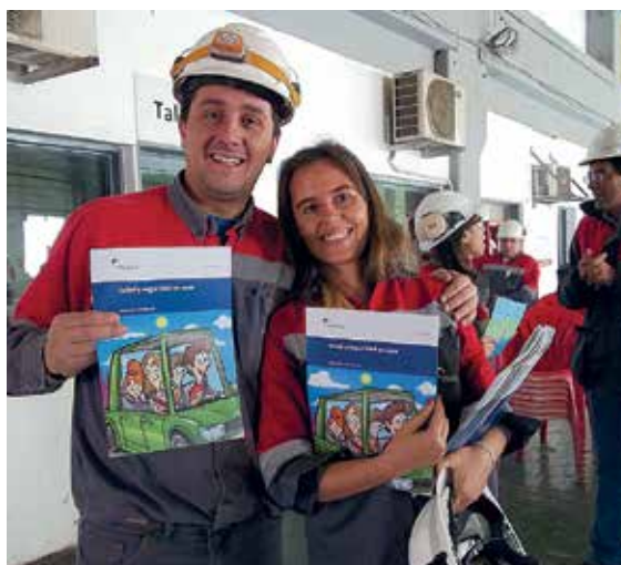
Colaboradores de Holcim Argentina reciben el brochure “Salud y Seguridad en casa”.