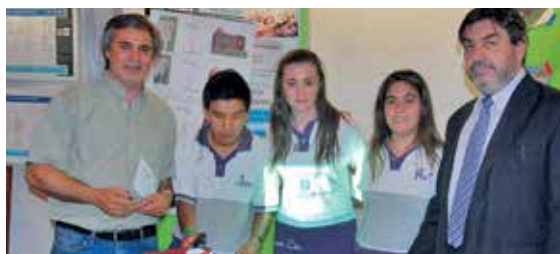
6° año - IPEyM 256 Lib. Gral. José de San Martín (Leones) + Beca FIE.