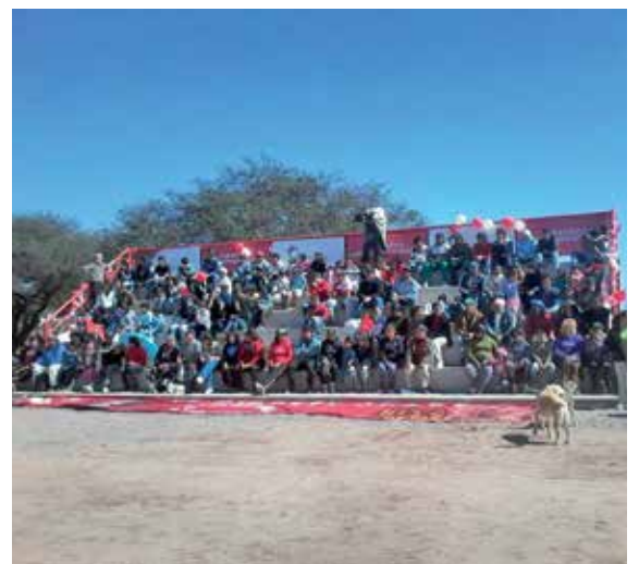
Para obtener más información sobre “Equipos grandes en pasión”: www.holcimpasion.com

Julio 2014: se inaugura la tribuna de cemento en la cancha del “CAI de El Piquete” y se entregan los premios a los 9 clubes ganadores de equipamiento e indumentaria.