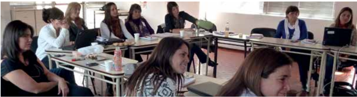
Equipo de RSC y FHA en la capacitación del Arq. Restrepo.

*FUENTE: Conclusiones del XV Congreso Iberoamericano de Urbanismo, Medellín, 2012.