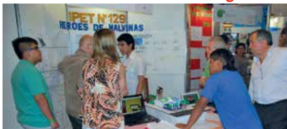
4° año - IPET 129 Héroes de Malvinas (Córdoba).