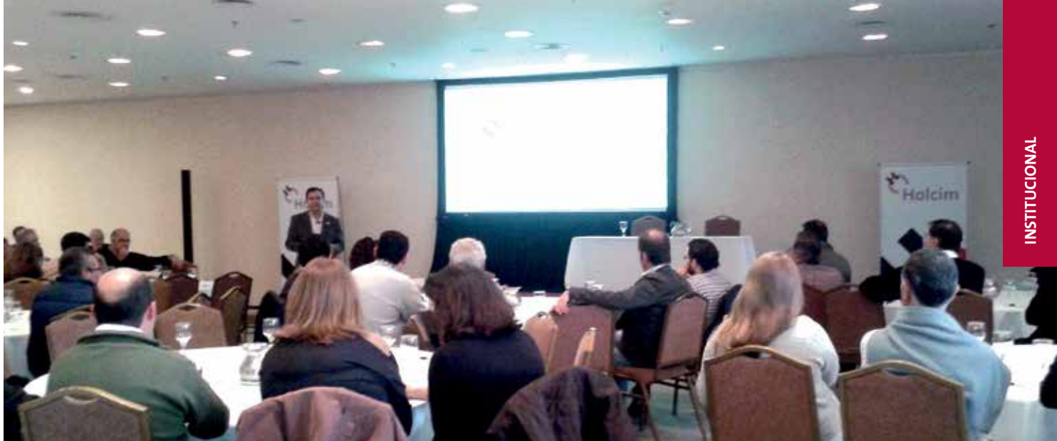
Charlas Constructivas de Holcim Argentina.