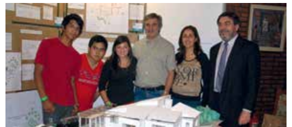
5° año - IPET 60 Mariano Moreno (Cosquín).