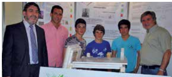
5° año - IPEA y T N° 347 (Embalse).