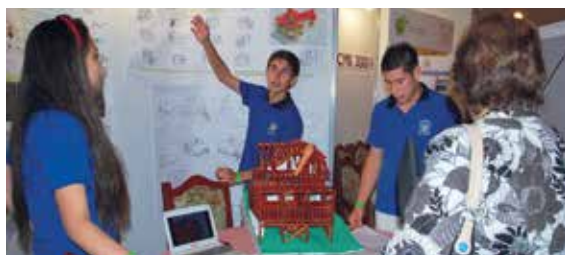
6° año - IPET 48 Presidente Roca (Córdoba).