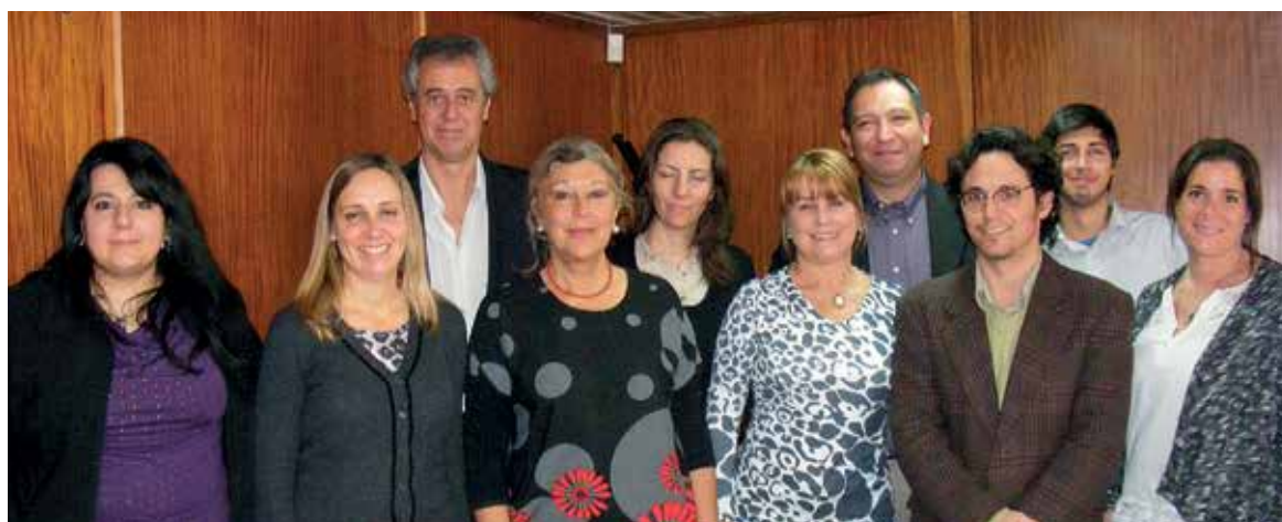
Representantes de Fundación Holcim Argentina, Fundación Cricyt, IADIZA Conicet, y Ministerio de Tierras, Ambiente y Recursos Naturales de la Provincia de Mendoza, en el lanzamiento del curso.

El tema es "Educación ambiental frente al cambio climático", y el objetivo del programa es incrementar el conocimiento y la conciencia sobre el problema ambiental.