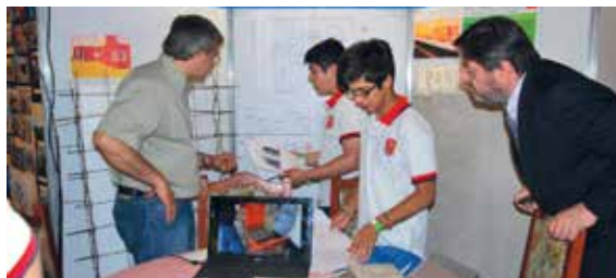
4° año - Instituto Paula Albarracín de Sarmiento (Villa Allende).