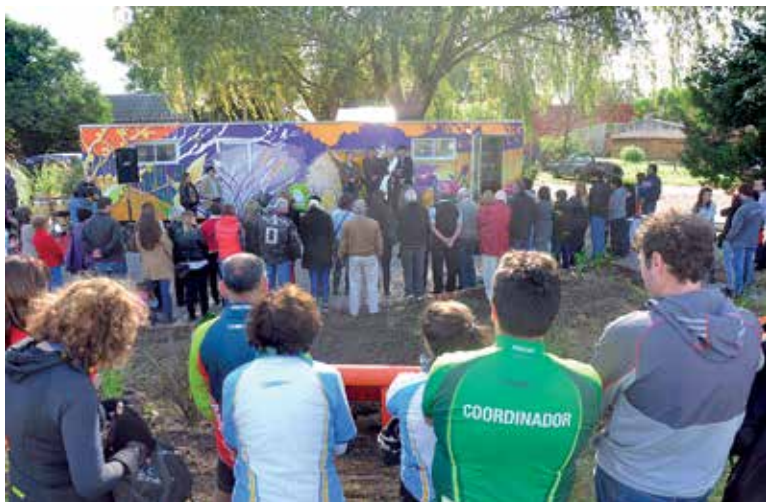
Inauguración de la nueva oficina de información turística en Otamendi.

Uno de los objetivos de la Fundación Holcim es promover el desarrollo turístico sustentable de la zona de Campana, en la provincia de Buenos Aires.